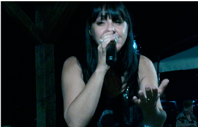
in foto Laura Leo (video Laura Leo)

Laura Leo, cantante, attrice e grandissima amica di Caterina le ha dedicato uno spettacolo con tutta la professionalità inconfondibile di cui è capace, e con tutta la passione, dedizione, commozione e grandissimo amore per Caterina, proprio secondo un codice degli uomini e delle donne dello spettacolo: "The Show must go on".